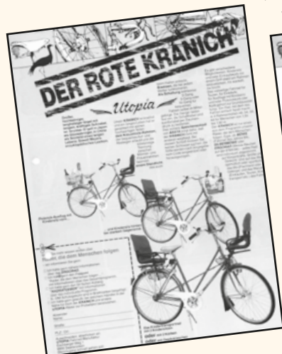
► 1988 erschien der Kranich Flyer und war für viele Jahre sehr wichtig ...