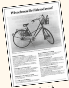
► Der erste Kranich Prospekt April 86.