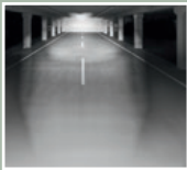
Fernlicht mit 170 Lux