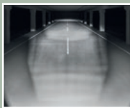
Abblendlicht mit 120 Lux