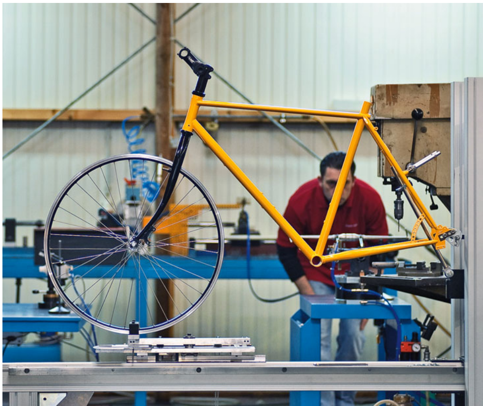
Stahl ist geduldig. Der zähe Werkstoff ist Teil des Anspruchs, besonders belastbare Räder zu bauen.

Details und ihren schier endlosen Kombinationen. Utopia ist einer der ersten Baukasten-Anbieter, und dieser Baukasten ist in manchen Fächern eher eine Schatzkiste. Mehr als zwei Jahrzehnte nach der Firmengründung ist Klagges dem Ziel näher gekommen, Alltagsradlern das technische Niveau des Rennradmarktes anzubieten. Manchmal waren die Utopisten von der Saar selbst an der Verbesserung der Auswahl beteiligt.