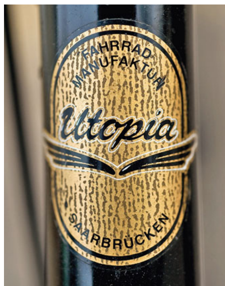
Zeitlose Utopie: Das Signet blieb fast unverändert.