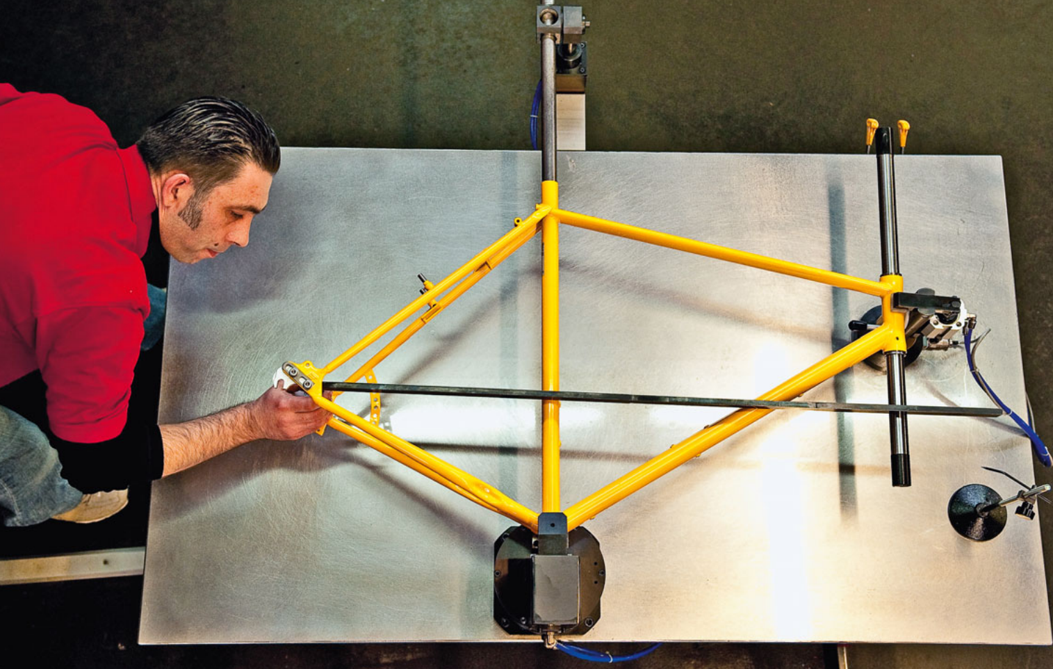
Jeder Rahmen wird vermessen, die Werte gespeichert. Das erleichtert nach einem Unfall die Diagnose.

entwickelte „Country“-Kettenschutz sind sehr gefragt. In Teilen wie diesem kulminiert die Utopia-Philosophie: Der Schützer umschließt die Kette komplett und steigert ihre Lebensdauer gewaltig, und das angeblich geräuschlos. Dass er dafür aus 38 Teilen besteht, vierhundert Gramm schwer ist und vom Käufer einen Aufpreis von fast 150 Euro erfordert, stört in der Utopia-Welt kein bisschen: „Erste Priorität haben bei uns Wartungsarmut und Fahrkomfort. Dem haben sich Gewicht und technische Details unterzuordnen“, sagt Klagges.