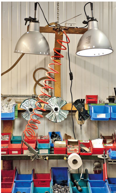
Vom Kettenschutz bis zum Nabenputzer: Jedes Teil ist genau ausgewählt, viele sind Sonderanfertigungen.

Klagges wirkt nicht wie ein Technikfreak. Aber die in jahrzehntelanger Arbeit ausgefeiltesten Details an Rahmen und Zubehör lassen ihn ganz diskret vor Stolz glühen. Die Kundschaft goutiert das und gibt viel Geld aus: Unter 1500 Euro ist ein Utopia kaum zu haben, der Durchschnittspreis liegt deutlich darüber. Etwa zwei Drittel der Utopia-Räder werden mit der teuren Rohloff-Nabe ausgerüstet, der SON-Nabendynamo und der selbst